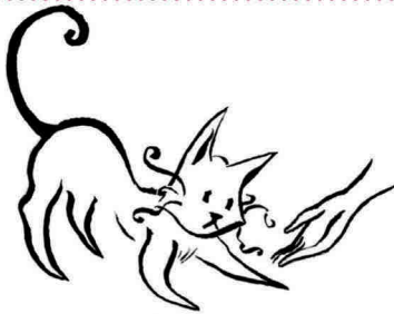
Chats d'Oc du Castéra

En cette rentrée 2019, un nouveau partenariat se crée entre la Mairie de Cadours et l'Association de la commune voisine Les Chats d'Oc du Castéra. Bien que les chats remplissent une fonction sanitaire en contenant les populations de rats et souris, il est nécessaire de