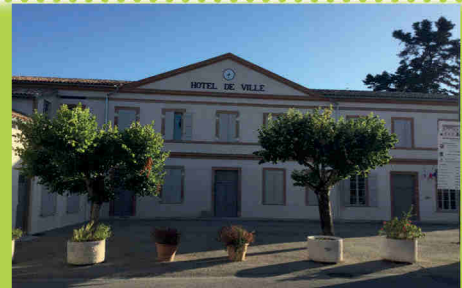
Mairie de Cadours - 2 rue d'Astarat - 31480

Tél : 05.61.85.60.01 — Fax : 05.61.85.62.19